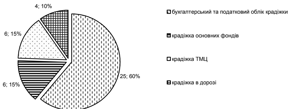
Рис. 1. Структура статей, присвячених питанням крадіжки в розрізі проблемних питань за період з 1999 по 2010 рр.

крадіжка основних фондів, крадіжка товарно-матеріальних цінностей, а також крадіжка в дорозі. З метою більш наочного відображення даних табл. 1 представимо результати дослідження на рис. 1.