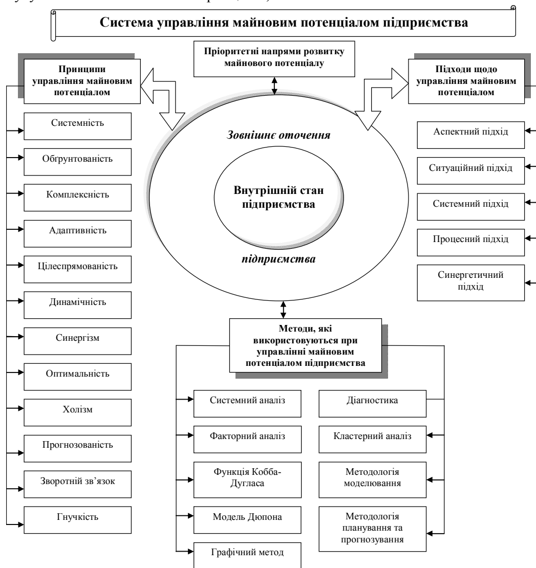
Рис. 1. Схема системи управління майновим потенціалом підприємства

підходів, методів щодо формування та використання даного потенціалу, а також пріоритетних напрямів його розвитку (рис. 1).