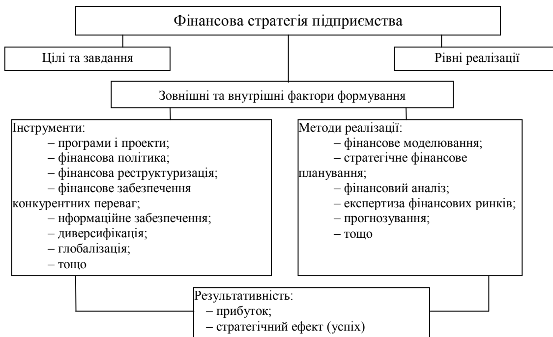
Рис. 1 Модель формування фінансової стратегії підприємства

Загальна схема формування фінансової стратегії включає наступні етапи: