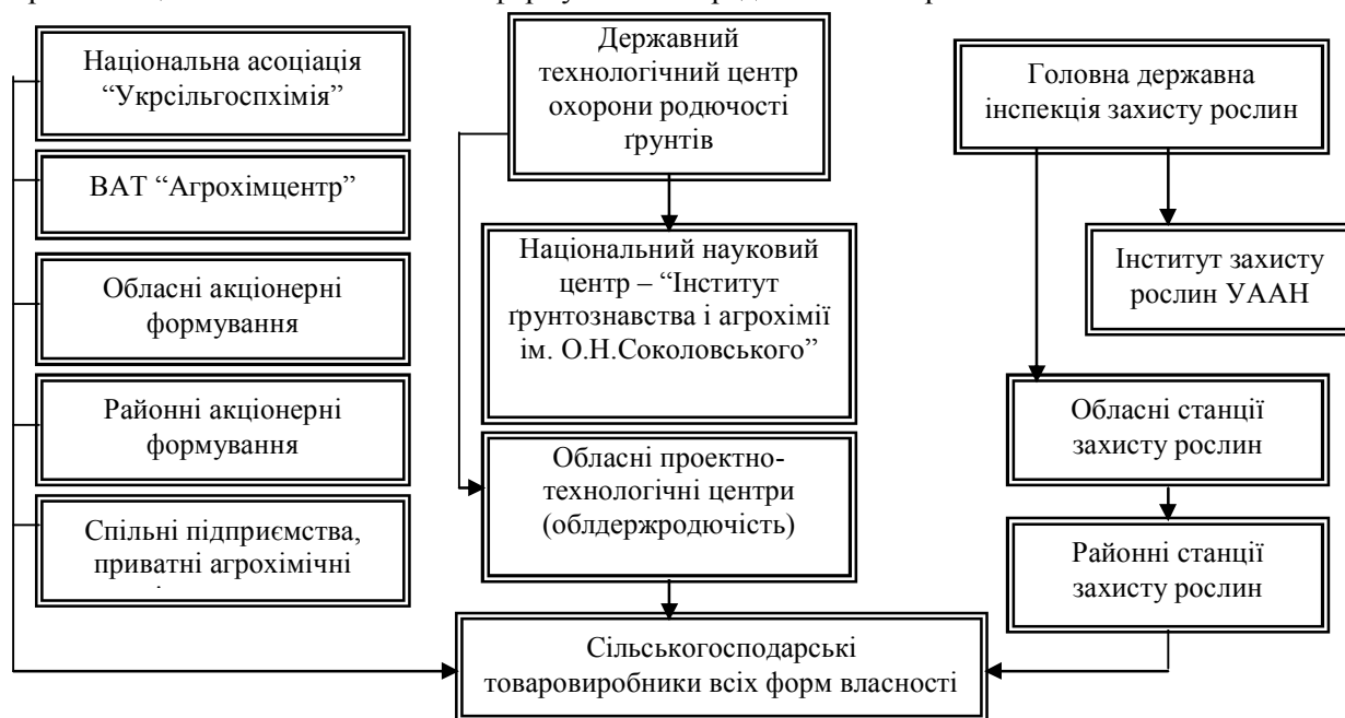
Рис. 2. Структура агрохімічної служби України після реформування

16 жовтня 1997 року в країні була створена Національна асоціація (НА) "Укрсільгоспхімія", засновниками якої стали 26 агрохімічних формувань "Облсільгоспхімії" в усіх регіонах України та Автономній республіці Крим, ВАТ "Агрохімцентр" (м. Київ) та Браїлівський виробничий центр реалізації засобів захисту рослин. У травні 1999 р. НА "Укрсільгоспхімія" офіційно зареєстрована як недержавна організація, мета якої – координація діяльності регіональних формувань щодо агрохімічного забезпечення сільськогосподарського виробництва та представництво інтересів засновників в органах державної влади. Структура реформованої агрохімічної служби представлена на рис. 2.