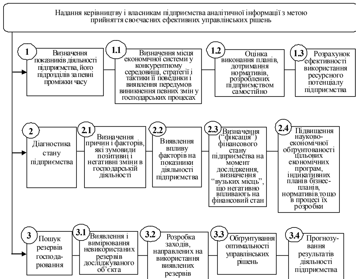
Рис. 3. "Дерево завдань" економічного аналізу діяльності суб'єкта господарювання: фрагментарний розріз

Викладання аналізу неможливе без теоретичними основами економічного викладачів і студентів, взаємодія яких дає аналізу для використання на практиці. можливість студентам оволодівати