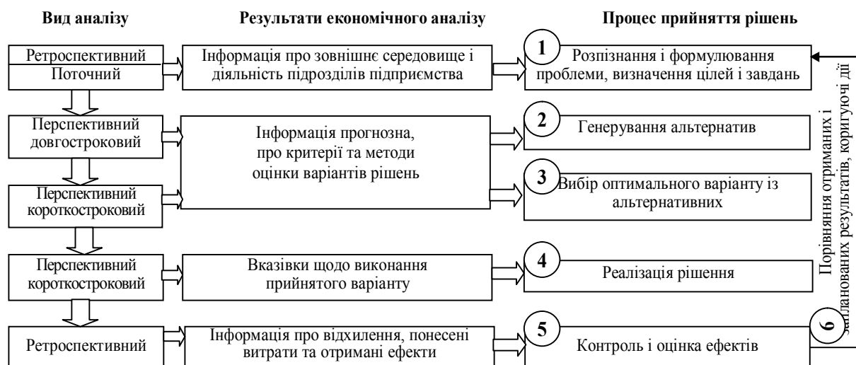
Рис. 1. Застосування видів економічного аналізу за часовою належністю в процесі прийняття рішень

Завдання економічного аналізу в управлінні підприємством є різним в залежності від етапів управління. Перед прийняттям рішення інформація, отримана з економічного аналізу, повинна уможливити оцінку ступеня використання засобів і позицій підприємства на ринку й ефективності господарювання. Роль економічного аналізу на етапі реалізації прийняття рішень повинна полягати у наданні інформації про неправдивість і порушення в діяльності по відношенню до прийнятих за основу порівнянь (минулий період, стан, прийнятий за зразок, плановий стан, стан в подібних підприємствах). Інформація, яка отримується шляхом економічного аналізу, повинна також дозволяти здійснювати дії, що коригують процес управління відповідно до прийнятих раніше положень (рис. 1).