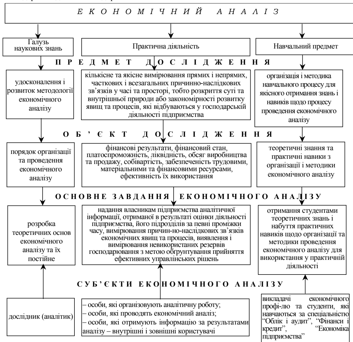
Рис. 2. Запропоноване розмежування об'єктів, предмету, завдань і суб'єктів економічного аналізу за трьома формами прояву

Викладання економічного аналізу у ВНЗ дає можливість сформувати знання і практичні навички, що базуються на наукових досягненнях, щодо організації та методики проведення економічного аналізу.