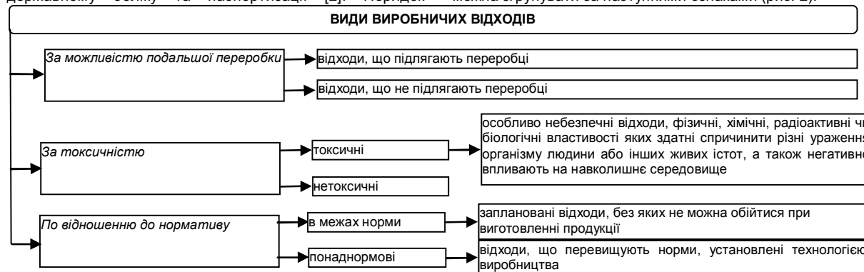
Рис. 2. Класифікація відходів виробництва для цілей бухгалтерського обліку

Відповідно до державного класифікатора, виробничі відходи для цілей відображення в бухгалтерському обліку можна згрупувати за наступними ознаками (рис. 2).