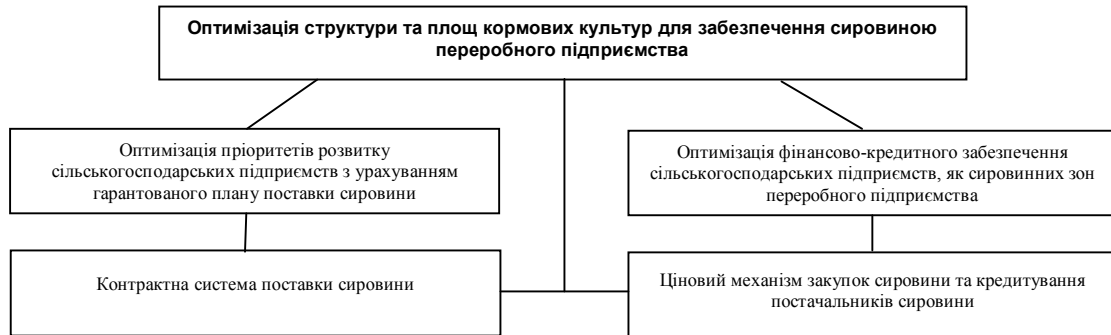
Рис. 2 Організаційно-економічний механізм формування товарно-кредитного кооперативу при створенні сировинної зони на основі контрактних відносин

З цієї метою на основі методів лінійного програмування нами розроблена економіко-математична модель оптимізації сировинної зони для переробного підприємства молочного напрямку та виробничої програми виробників сировини, зокрема молока.