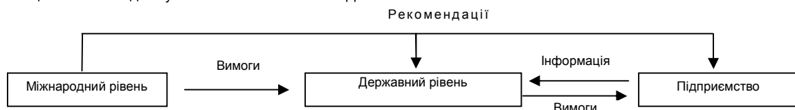
Рис. 2. Взаємозв'язок рівнів регулювання якості продукції

Рівні регулювання якості продукції є взаємопов'язані та взаємообумовлені, що можна представити за допомогою рис. 2.