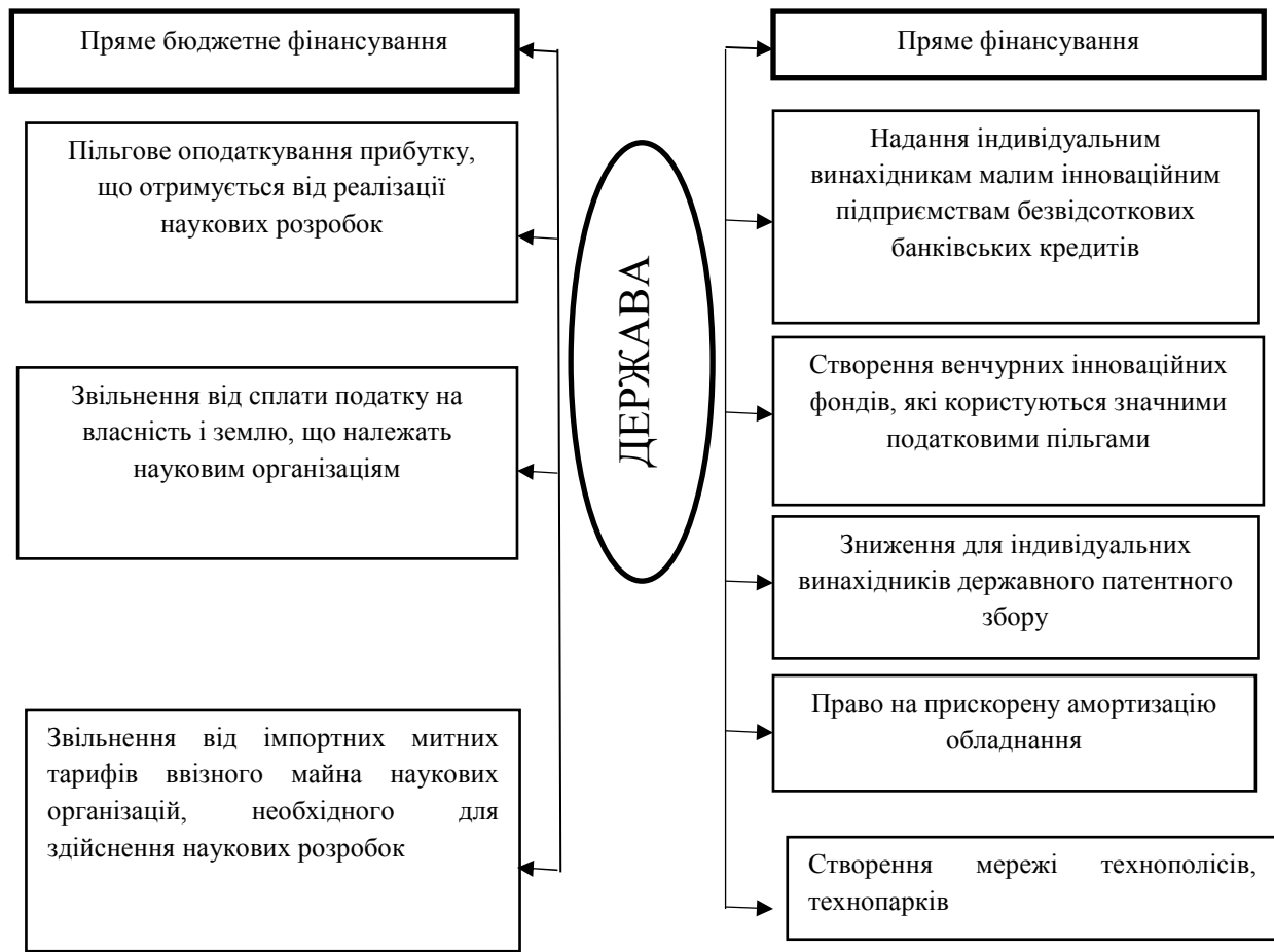
Рис. 1. Форми державної підтримки наукової та інноваційної діяльності

Економічна і соціальна роль держави в сучасному суспільстві визначають функції державних органів по регулюванню інновацій. До найбільш важливих з них відносяться такі, що зображені на рисунку 2.