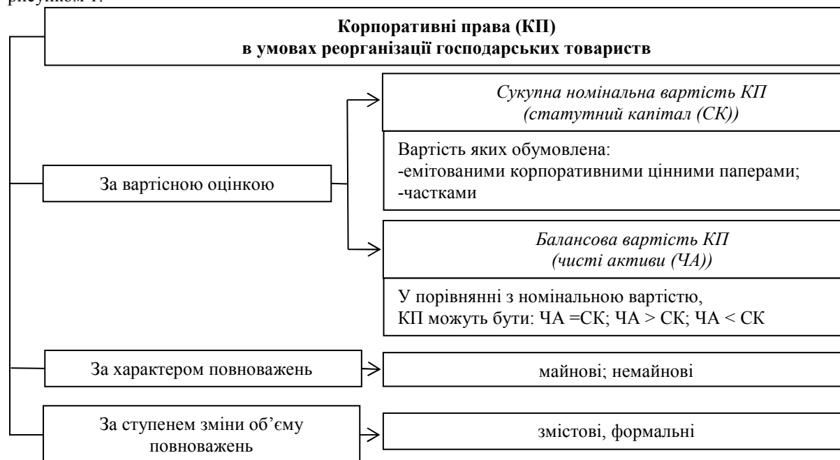
Рис. 1. Зміст корпоративних прав в умовах реорганізації господарських товариств

Узагальнений зміст корпоративних прав в умовах реорганізації господарських товариств наведено рисунком 1.