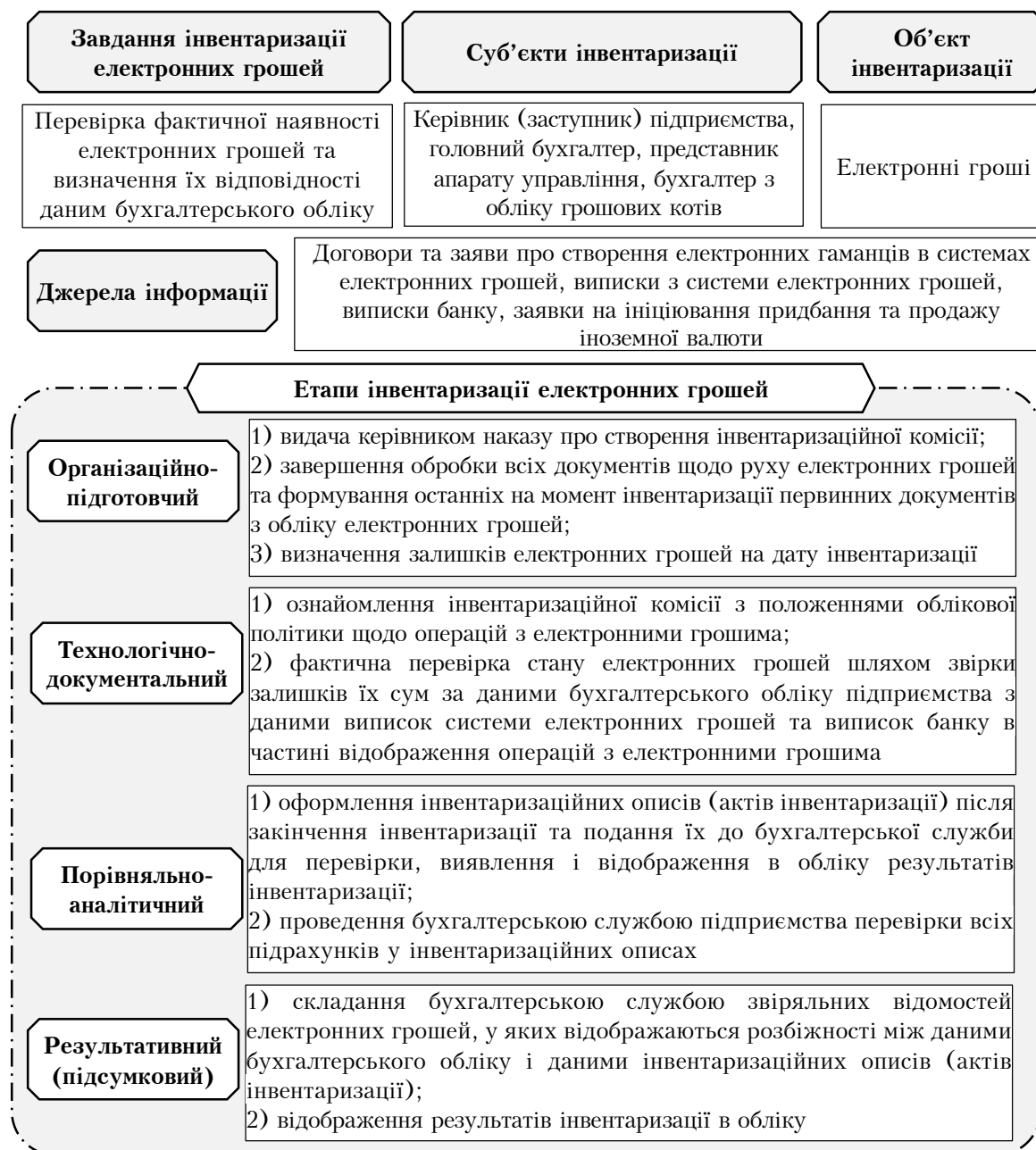
Рис. 1. Порядок проведення інвентаризації електронних грошей відповідно до етапів

Отже, основним завданням інвентаризації електронних грошей є виявлення їх фактичної наявності та перевірка відповідності даним бухгалтерського обліку, що забезпечить уникнення викривлень у фінансовій звітності підприємства та надання користувачам більш достовірної інформації про обсяги розрахунків електронними грошима та їх залишки на дату балансу як складової високоліквідних активів підприємства.