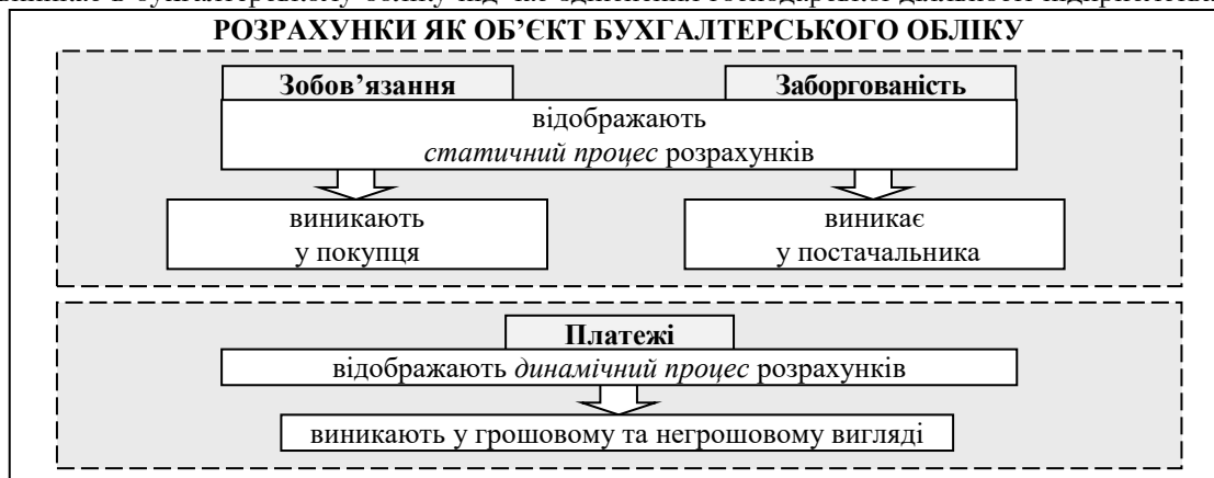
Рис. 2. Взаємозв'язок між поняттями «розрахунки», «зобов'язання», «заборгованість» та «платежі» в бухгалтерському обліку

У ході дослідження нормативно-правових актів виявлено, що в законодавстві обґрунтовано платежі лише в грошовому вигляді. Але, на нашу думку, платежі в бухгалтерському обліку доцільно характеризувати як у грошовому, так і негрошовому вигляді. Адже вони є основою для здійснення розрахунків, які, в свою чергу, можуть здійснюватися як грошовими коштами, так і у вигляді товарів, продукції, надання послуг різного характеру тощо. На рисунку 2 зображено взаємозв'язок між поняттями «розрахунки», «зобов'язання», «заборгованість» та «платежі», який виникає в бухгалтерському обліку під час здійснення господарської діяльності підприємствами.