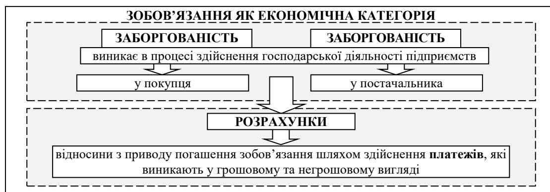
Рис. 3. Взаємозв'язок між поняттями «розрахунки», «зобов'язання», «заборгованість» та «платежі»: економічний зміст

Розрахунки, як зазначалося вище є категорією економічною. Тому з метою розмежування сутності даного поняття облікового та економічного характеру, на рисунку 3 зображено взаємозв'язок між поняттями «розрахунки», «зобов'язання», «заборгованість» та «платежі» з економічної точки зору.