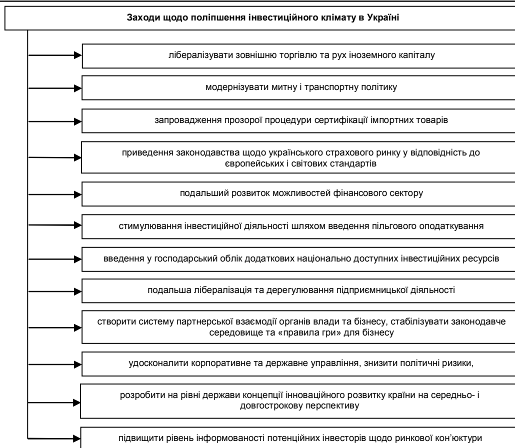
Рис. 2. Заходи поліпшення інвестиційного клімату в Україні

Зниження політичних ризиків відбувається шляхом прийняття законів, які унеможливають досудове відчуження приватної власності, у тому числі за участю податкової інспекції та місцевих адміністрацій.