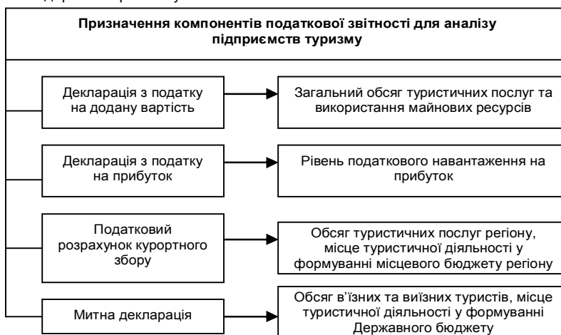
Рис. 3. Призначення компонентів податкової звітності для аналізу підприємств туризму

Податкова звітність – обов'язковий офіційний документ, в якому формуються дані про господарську діяльність у вигляді заповненої декларації, що подається у податкові органи для підтвердження об'єктів оподаткування та податкових платежів. Характеристика податкових джерел інформації в туризмі представлена на рисунку 3.