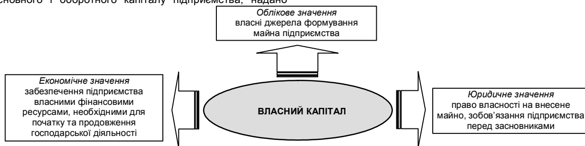
Рис. 2. Сутність власного капіталу

Таким чином, на нашу думку, власний капітал необхідно розглядати у трьох значеннях (рис. 2).