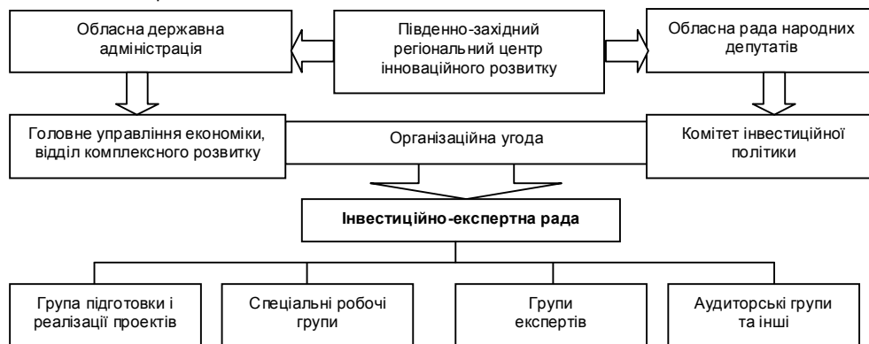
Рис. 2. Система організаційних структур, які забезпечують взаємодію учасників інвестиційного комплексу Вінницького регіону

На основі відповідних звітів, сформованих незалежними експертами, ІЕР здійснює ранжування найбільш привабливих підприємств і відпрацьовує рекомендації для всіх учасників стратегії щодо формування нових "точок зростання". У подальшому ці аналітичні матеріали стануть основою для розроблення розгорнутих інвестиційних пропозицій.