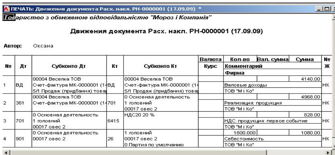
Рис. 4. Проводки, створені видатковою накладною

Для редагування суми попередньої оплати служить прапорець "Указать сумму предварительной оплаты вручную".