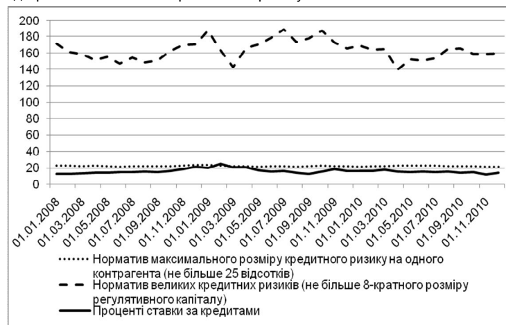
Рис. 1. Динаміка рівня кредитного та ставок за кредитами в банках України у 2008-2010 рр. (складено автором на основі [8, 9])

Досліджуючи рівень впливу кредитного ризику на процеси банківського ціноутворення в Україні (рис. 1), за показник рівня кредитного ризику було обрано узагальнене по всій банківській системі значення нормативів Національного банку України щодо кредитного ризику банків.