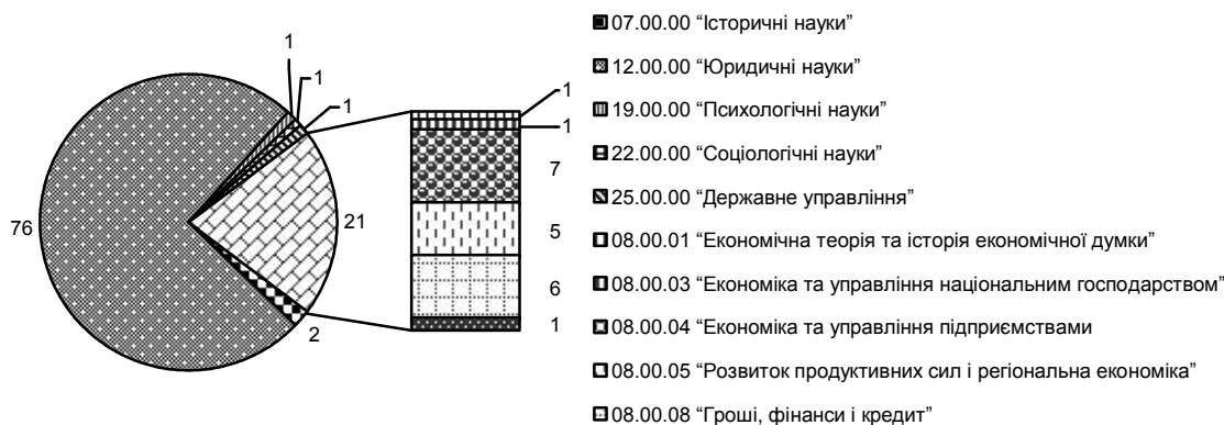
Рис. 3. Кількісний склад авторефератів, які містять у назві слово "майно", за галузями науки (за галуззю науки 08.00.00 "Економічні науки" в розрізі спеціальностей)

ступеня доктора економічних наук, що свідчить про відсутність комплексного дослідження за даною тематикою.