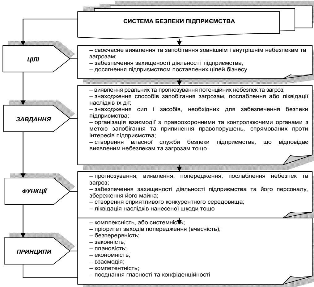
Рис. 1. Система безпеки підприємства

Система безпеки підприємства представлена на рис. 1 (розроблено за [6]).