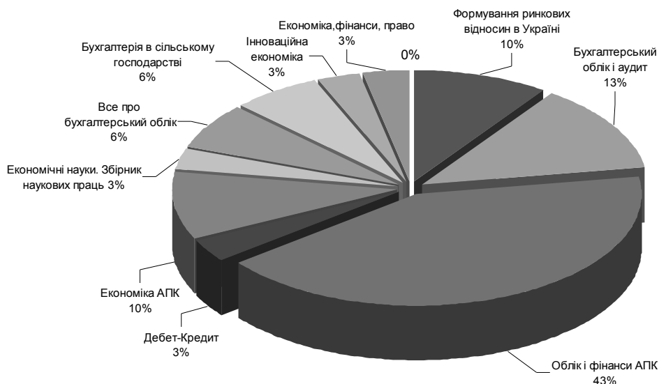
Рис. 4. Періодичні видання з бухгалтерського обліку біологічних активів тваринництва

– недоліки методики оцінки, оприбуткування та вибуття біологічних активів; – визначення місця і ролі біологічних активів в господарському процесі; – вдосконалення обліку біологічних активів.