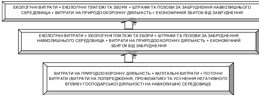
Рис. 1. Взаємозв'язок та склад екологічних, природоохоронних витрат та витрат на природоохоронну діяльність підприємства

Отже, логічно виникла потреба у остаточному розмежуванні вищезначених понять. У даному дослідженні під природоохоронними витратами підприємства вважатимемо сукупність його витрат понесених на проведення активних природоохоронних заходів з метою запобігання, попередження, зниження та компенсації негативного впливу виробничо-господарського процесу на навколишнє середовище, а також на ліквідацію наслідків такого впливу.