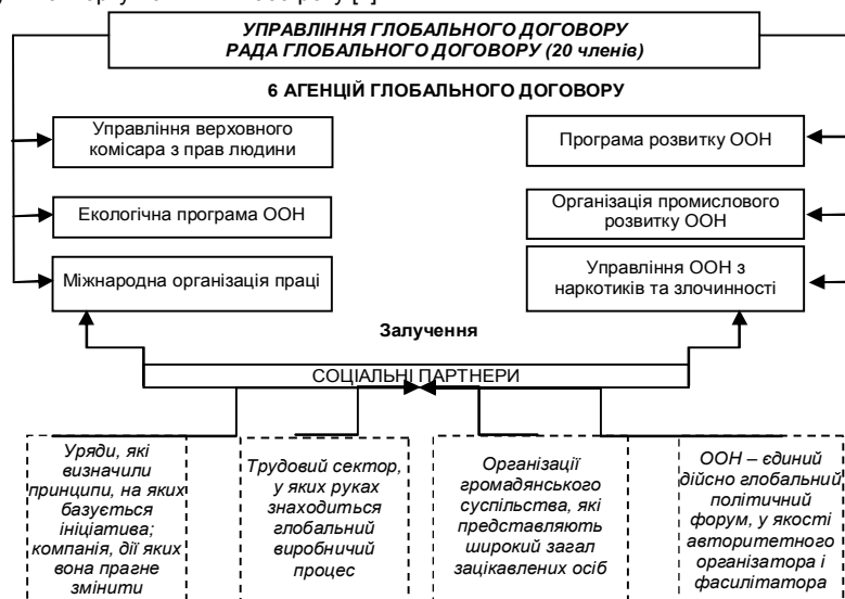
Рис. 1. Організаційна структура мережі Глобального договору

Глобальний договір представляє собою світову мережу організацій, що має певну структуру (рис. 1).