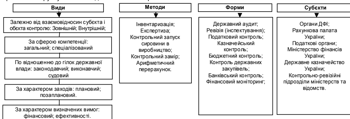
Рис. 1. Діюча система державного фінансового контролю в Україні (види, методи, форми та суб'єкти)

Так, діюча система державного фінансового контролю в розрізі ключових її складових (видів, методів, форм та суб'єктів) наведена на рис. 1.