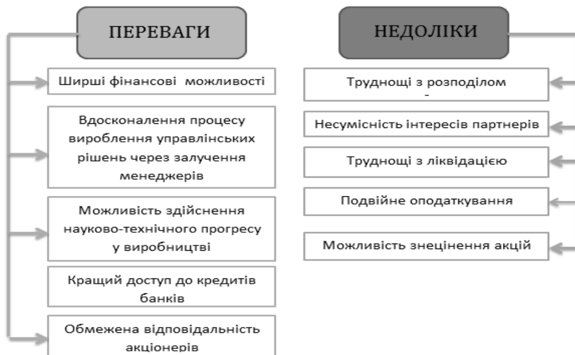
Рис. 2. Переваги та недоліки корпоративної форми організації підприємницької діяльності

Коротку характеристику основних переваг та недоліків корпоративної форми організації підприємницької діяльності представимо у вигляді схеми (рис. 2).