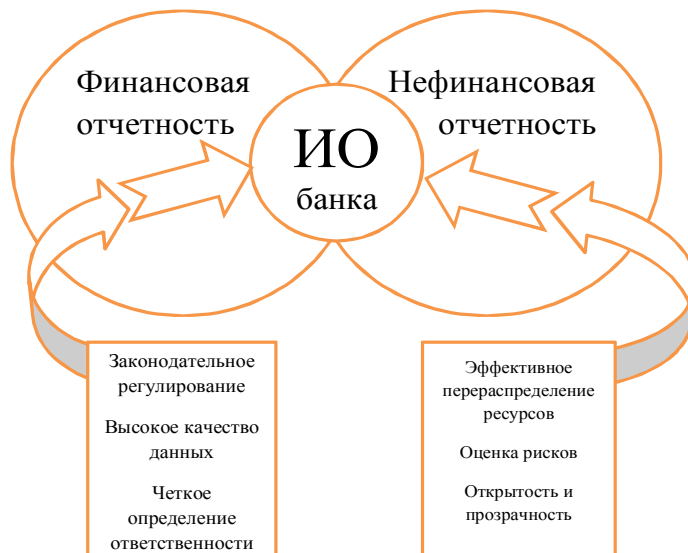
Рис. 1. Обобщенная модель системы (концепции) интегрированной отчетности банка.

– Риски (РИСКИ) – раскрытие информации о величине финансовых (кредитный, процентный, рыночный и риск ликвидности) и нефинансовых (стратегический, операционный и риск репутации) рисков банка с указанием источников их покрытия;