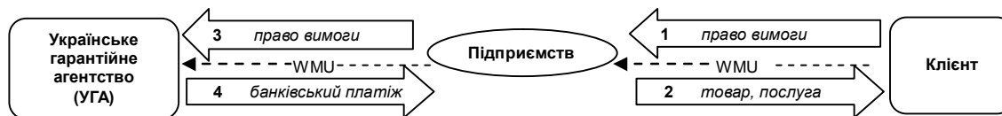
Рис. 1. Схема процесу реалізації товару з отриманням прав вимоги

Операція з продажу товару (надання послуги) в обмін на право вимоги між підприємством та клієнтом може бути оформлена договором, в тому числі і у вигляді оферти на сайті, і підтверджена відповідними первинними бухгалтерськими документами, які оформляються так само, як і при звичайній покупці товару, послуги за грошові кошти.