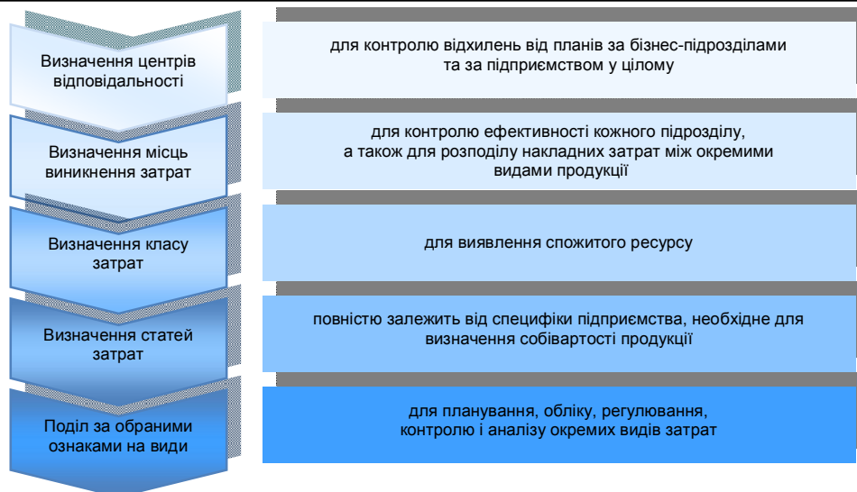
Рис. 2. Механізм класифікації витрат

Відтак, розробка класифікації витрат підприємства включає: визначення центрів відповідальності; визначення місць виникнення затрат (з деталізацією від підрозділу до робочого місця); визначення класу затрат на основі їх економічної природи (затрати засобів праці, затрати предметів праці, трудові затрати, соціальні затрати, накладні затрати); визначення об'єкта понесення затрат (розподіл за видами продукції, за підрозділами чи технологічними операціями) і, нарешті, класифікація за функціями управління залежно від цілей (поділ за обраними ознаками на види).