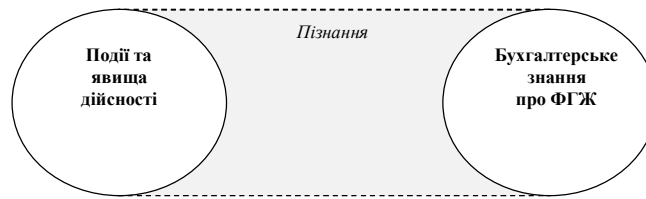
Рис. 1. Подвійне розуміння ФГЖ

2) бухгалтерський облік є набором постулатів та методів структуривання знань у свідомості. При чому "знання" є результатом смислотворюючої направленості свідомості до світу незалежно від (не)реальності предмету (рис. 2).