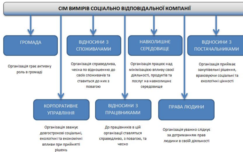
Рис. 1. Сім вимірів соціально відповідальної компанії

Отже в рамках концепції корпоративної соціальної відповідальності діяльність підприємства розглядається з точки зору її соціального, економічного, екологічного впливу на всі складові її внутрішнього та зовнішнього середовища. Існують різні варіанти трактування цього впливу з точки зору його елементів та характеру впливу. На нашу думку одним з найбільш цікавих і близьких нам за поглядом на концепцію КСВ є підхід одного з лідерів ринку консалтингових послуг компанії Хьюїт Асошіейтс (Hewitt Associates), яка сформулювала сім вимірів соціально відповідальної компанії, що показані на рисунку 1 [4].