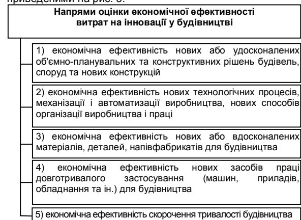
Рис. 3. Напрями оцінки економічної ефективності витрат на інновації у будівництві

На основі проведеного аналізу наявних досліджень, можна говорити про те, що в основному в них розглянуті загальні підходи до методики оцінки результатів інноваційної діяльності у будівництві. Опрацювавши обліково-економічну літературу [2,5,7,12,13] та нормативно-інструктивні документи [8,9] щодо даного питання, оцінку економічної ефективності витрат на інновації у будівництві слід розглядати за напрямками, приведеними на рис. 3.