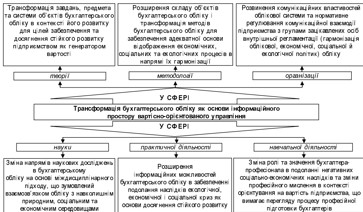
Рис. 2. Напрями трансформації системи бухгалтерського обліку в рамках досягнення стійкого розвитку як основи формування вартості підприємства

На основі взаємозв'язку інституційного інтересу та інституційного запиту учасників економічних відносин визначено напрями трансформації системи бухгалтерського обліку, яка створює інформаційний простір управління соціальною, екологічною та економічною діяльностями, ефективність провадження яких спричиняє вплив на рівень вартості підприємства (рис. 2).