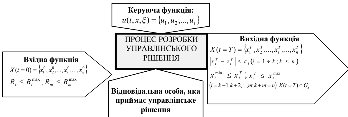
Рис. 1. Формалізована модель процесу розробки управлінських рішень в системі управління розвитком підприємства

Таким чином, запропонована формалізована модель процесу розробки управлінських рішень в системі управління розвитком підприємства (рис.1) має «вхід», «вихід», «механізми» та певну керуючу функцію. Так, на «вході» підприємство здійснює оцінку кількісних та якісних параметрів, які є визначальними під час прийняття управлінського рішення щодо розвитку підприємства, ідентифікує наявні у своєму розпорядженні ключові ресурси, оцінює фактори взаємодії. На «виході» формується цільова вихідна функція, на основі якої можливо врахування цільових параметрів із зазначенням можливих допустимих відхилень від запланованих значень у допустимих межах. При цьому, слід зазначити, що реалізація процесу прийняття ефективного управлінського рішення ускладнюється можливою альтернативністю визначених параметрів, які є параметрами керуючої функції та компетентністю відповідальної особи, яка розробляє та, з безлічі можливих альтернатив, обирає те рішення, яке є найбільш доречним в певній ситуації. Саме необхідність оцінки альтернатив \{u_1, u_2, \dots, u_l\} , їхня оцінка на відповідність критеріям переваг і співставлення з можливостями для досягнення цілей, актуалізує вирішення питання визначення детермінант технології прийняття управлінського рішення.