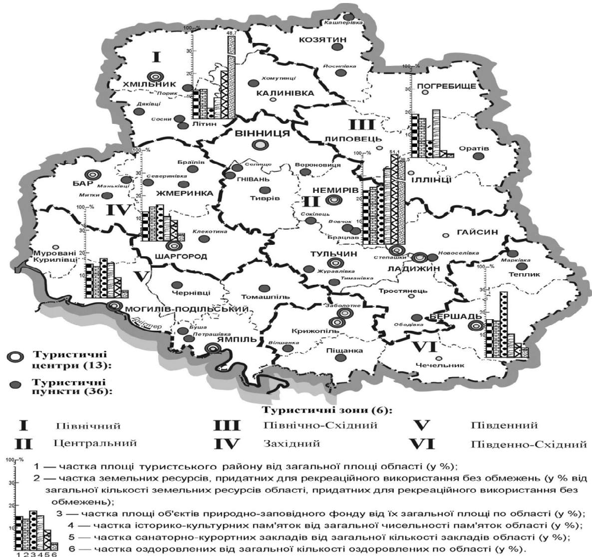
Рис. 1. Функціонально-територіальна структура ТРК і її елементи

Розподіл туристично-рекреаційного потенціалу області за виділеними вище туристськими зонами наведено в таблиці 1.