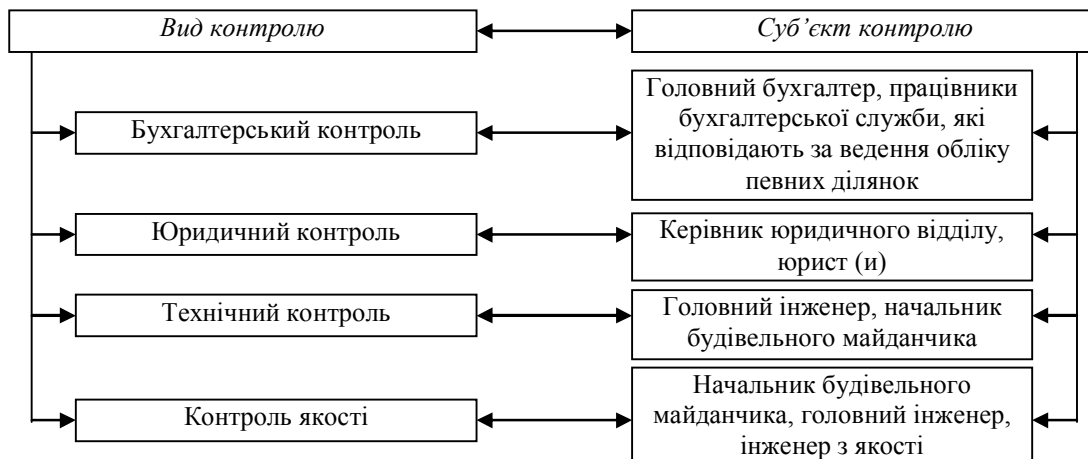
Рис. 3. Суб'єкти внутрішнього контролю за укладанням та виконанням договорів підряду

Важливе місце в структурі суб'єктів внутрішнього контролю займає контроль, який повинен здійснюватися кожним працівником (робітником) на своєму робочому місці – самоконтроль. Об'єктом самоконтролю є окрема операція, яка здійснюється для виконання посадових та інших