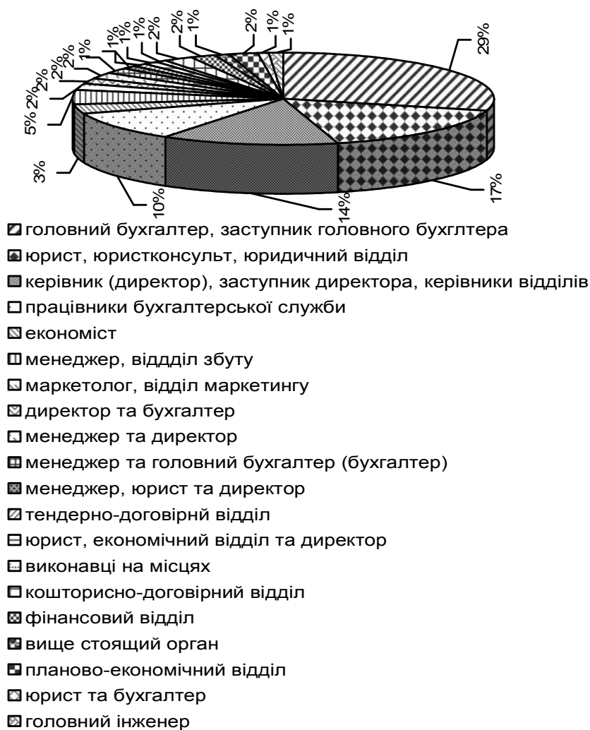
Рис. 2. Суб'єкти проведення внутрішнього контролю за виконанням договорів в частині повноти розрахунків за договорами