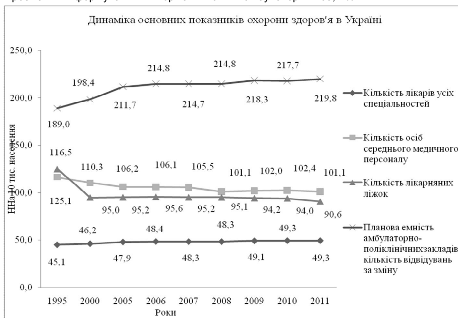
Рис. 1. Динаміка основних показників охорони здоров'я в Україні в 2011 р.

За даними офіційної статистики МОЗ України, у 2011 році загальна кількість лікарів (усіх спеціальностей) становила 202370 осіб (рис. 1), а штатних лікарських посад нараховується 224876. Відсоток укомплектованості лікарями становив 79,5 %, при цьому відсоток укомплектованості обласних лікарень – 85,1 %, міських – 77,8 %, центральних районних лікарень – 76,2 %, дільничних – 71,3 %, селищних лікарських амбулаторій – 69,2 %.