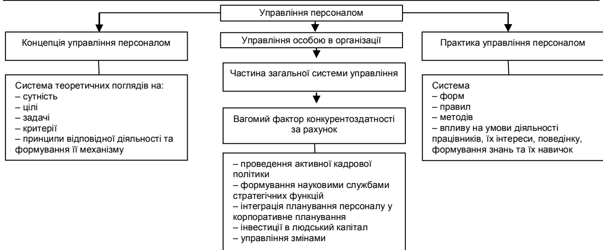
Рис. 1. Система управління персоналом

На даному рисунку визначено необхідність поєднання теоретичних концепцій й практичних підходів в організації управління персоналом.