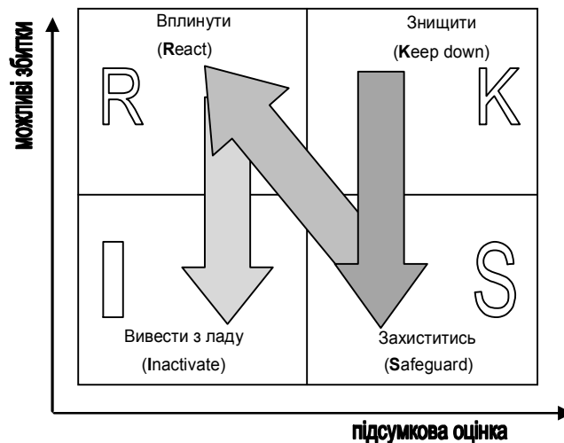
Рис. 2. Ризик-навігатор стратегічного розвитку підприємства