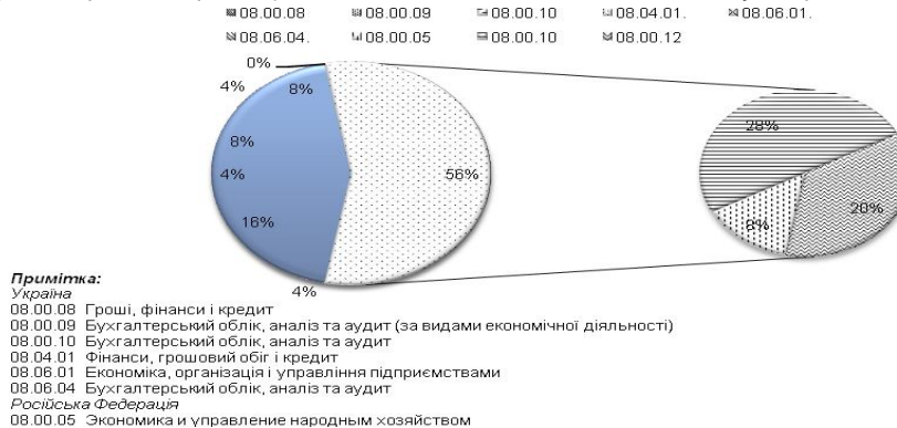
Рис. 3. Кількість авторефератів за напрямом "страхові резерви" за галузю науки "Економічні науки" в розрізі спеціальностей

Таким чином, питання страхових резервів в економічному напрямі, згідно раніше вказаної вибірки, піднімалися в 25 роботах вітчизняних та російських науковців. Кількісний склад авторефератів дисертаційних робіт, захищених в Україні за спеціальностями галузі "Економічні науки" представлено на рис. 3.