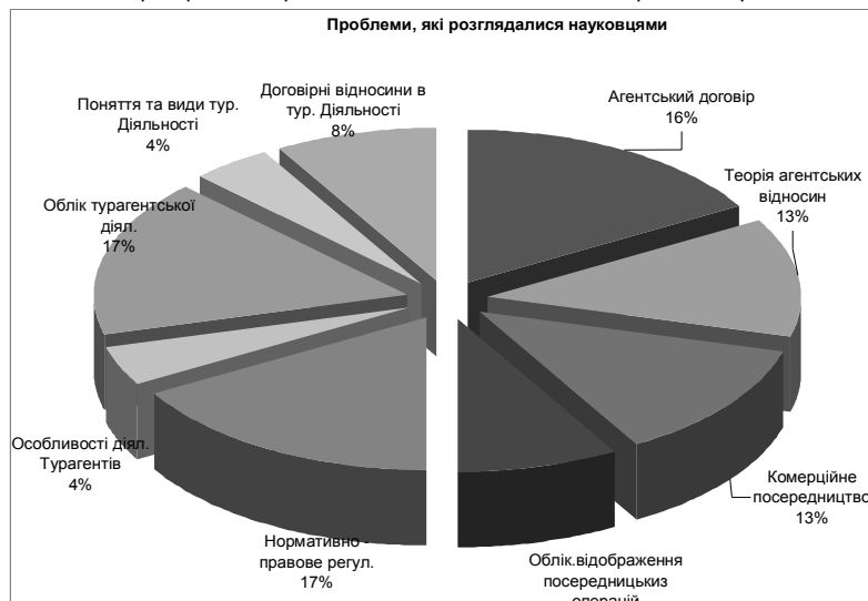
Рис. 3. Огляд проблем, які стосуються питання агентських відносин

Проблеми, які стосуються питання агентських відносин і які дослідженні в працях різних науковців можемо спостерігати на рис. 3