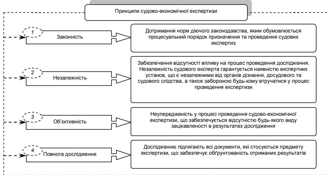
Рис. 1. Принципи проведення судово-економічних експертиз

Узагальнюючи вищевикладене, суб'єктом судово-експертної діяльності є судовий експерт, який може бути як фахівцем державної спеціалізованої установи, так і особою, яка має необхідні спеціальні знання, проте не є співробітником вказаної установи. Зокрема, відповідно до приписів ст. 10 Закону України "Про судову експертизу", судовими експертами можуть бути фахівці, які мають відповідну вищу освіту, освітньо-кваліфікаційний рівень не нижче спеціаліста, пройшли відповідну підготовку та отримали кваліфікацію судового експерта з певної спеціальності [5].