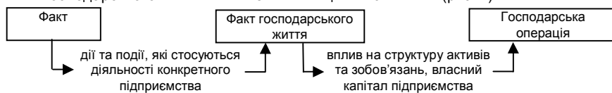
Рис. 1. Взаємозв'язок між фактом, фактом господарського життя та господарською операцією

Вважаємо, що під категорією “факт господарського життя” слід розуміти дію або подію, що дійсно відбулися в діяльності конкретного підприємства та в подальшому можуть призвести до змін в структурі активів та зобов'язань, власному капіталі підприємства, а можуть і не призвести. Таким чином, покажемо взаємозв'язок між цими поняттями (рис. 1).