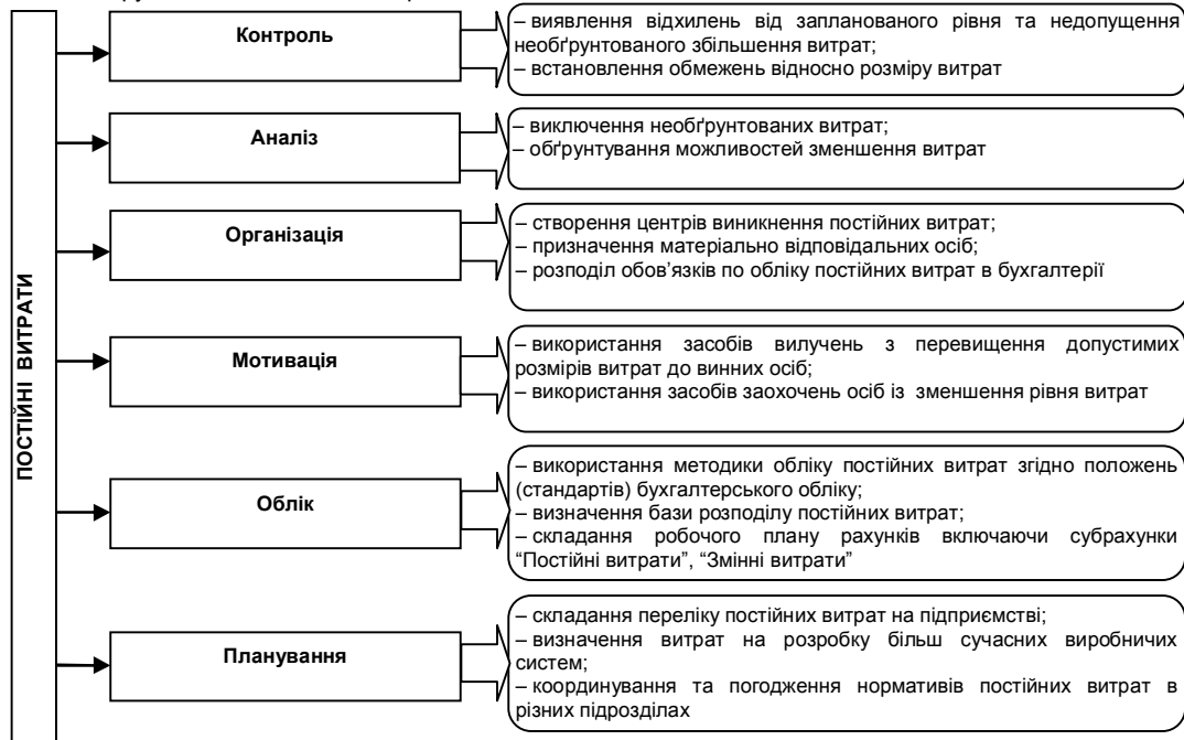
Рис. 1. Функціональний підхід до управління постійними витратами

витрат і систематичного проведення економічного аналізу, оскільки серед постійних витрат можуть бути неефективні витрати або необґрунтовані (рис. 1).