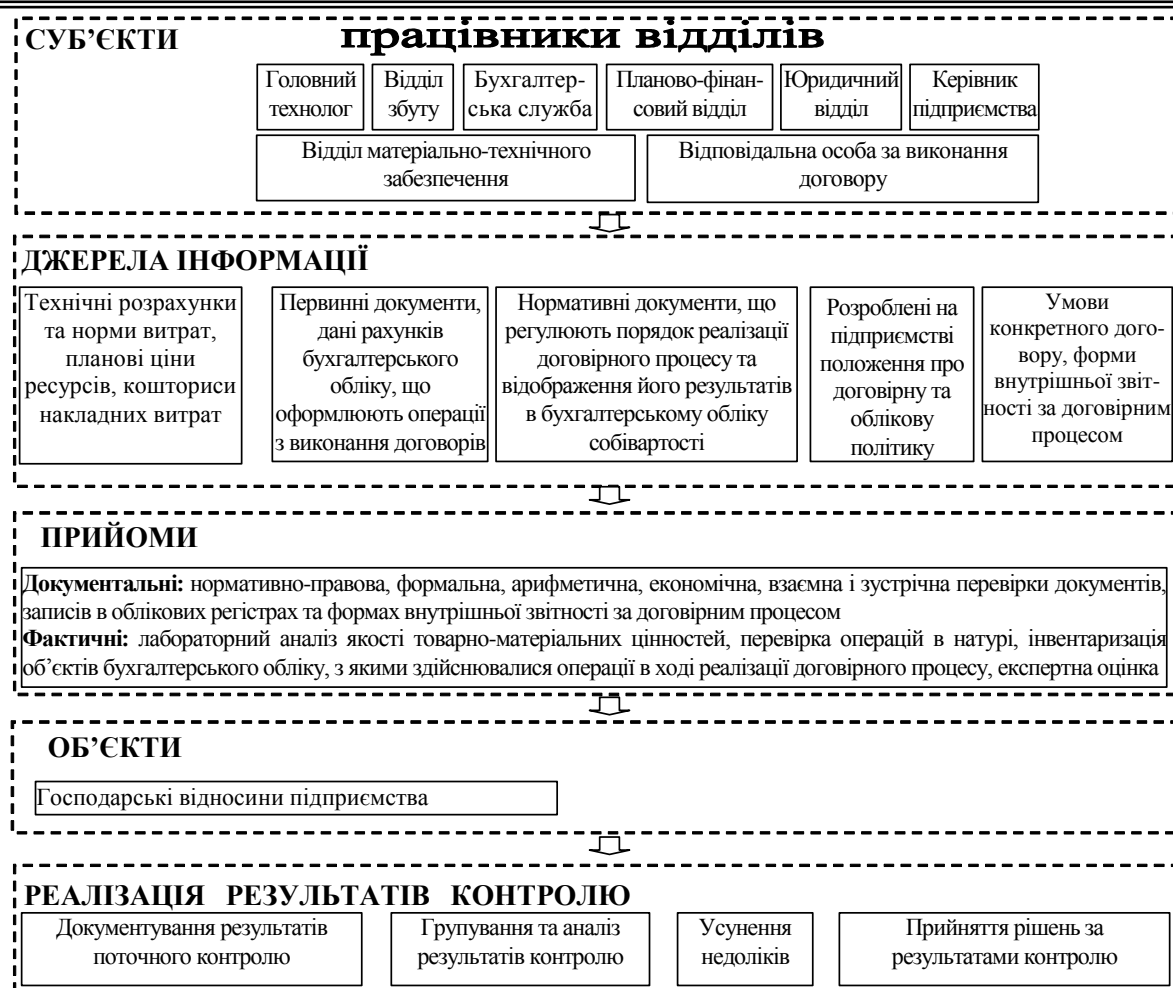
Рис. 4. Загальна методика здійснення внутрішньогосподарського контролю договірному процесу 4

Висновки та перспективи подальших досліджень. У ході дослідження визначено об'єкти та суб'єкти внутрішньогосподарського контролю договірному процесу; сформульовано завдання, які підлягають вирішенню у ході здійснення внутрішньогосподарського контролю договірному процесу; визначено прийоми, які використовуються під час реалізації внутрішньогосподарського контролю договірному процесу, що дало змогу розробити загальний порядок здійснення внутрішньогосподарського контролю договірному процесу. Перспективним напрямом дослідження є питання зовнішнього контролю договірному процесу.