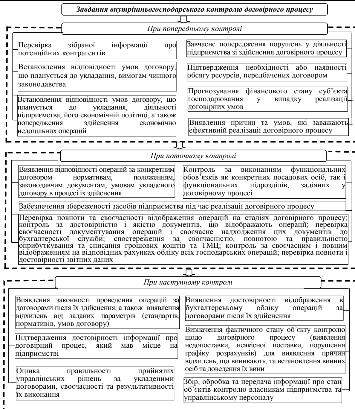
Рис. 3. Завдання внутрішньогосподарського контролю договірному процесу 3

Узагальнення результатів теоретичних та аналітичних досліджень у сфері внутрішньогосподарського контролю свідчить про необхідність комплексного підходу до організації внутрішньогосподарського контролю договірному процесу. Для отримання найбільш повної та достовірної інформації про належну реалізацію договірному процесу необхідною є розробка загального порядку здійснення внутрішньогосподарського