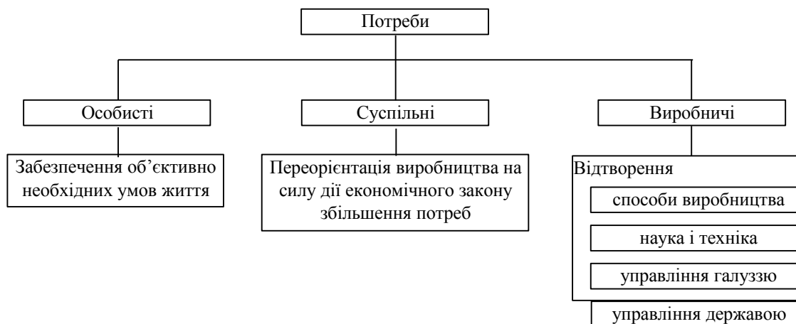
Рис. 1 Потреби в структурі суспільних відносин

Результати досліджень. Першим джерелом, що приводить особистість до розподілу, виступає потреба – “нестаток у чому-небудь необхідному для підтримки життєдіяльності організму, людської особистості, соціальної групи, суспільства в цілому” [6, с. 518]: потреба людини в чомусь, потреба суспільства в чомусь і т.і. Інші джерела повинні розглядатися як похідні від неї, від потреби. Потреба – це генератор, що перетворює багатство фантазії й уяви людини в зовсім реальні обриси продуктів, послуг і робіт. Її зміст у вигляді укрупненої схеми поданий на рис. 1.