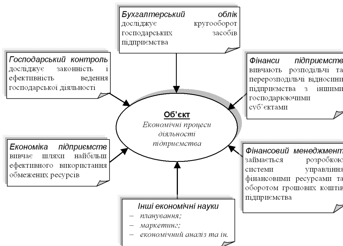
Рис 3. Економічні процеси діяльності як об'єкти вивчення різних наук

Об'єктами економічного аналізу виступають усі аспекти діяльності й інші процеси, пов'язані з нею. Зауважимо, що діяльність/використання об'єктів економічного аналізу характеризує сукупність взаємопов'язаних виробничих і комерційних процесів, а також економічних явищ, що відображають різноманітні сторони економічних відносин. Здійснення виробничих і комерційних процесів приводить аналізований об'єкт до певних кінцевих результатів, що виступають вже аспектом фінансового аналізу.