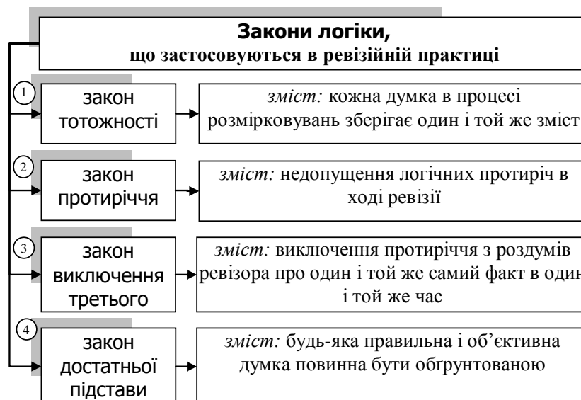
Рис. 1. Закони логіки, що застосовуються у ревізійній практиці

Проф. Бутинець Ф.Ф. чітко відзначає, що в ревізійній практиці при побудові версій застосовуються закони формальної логіки, зокрема закон тотожності, закон протиріччя, закон виключення третього, закон достатньої підстави [2, с. 43]. (рис. 1).