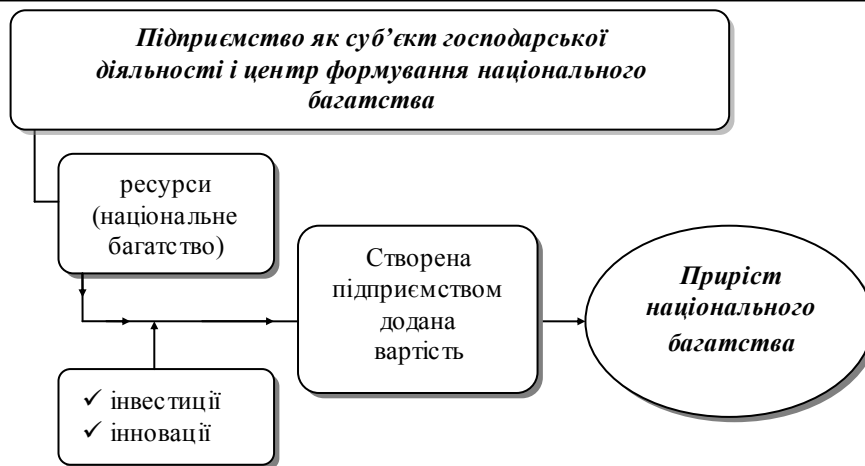
Рис. 1. Порядок формування національного багатства підприємством

Підприємство як головний центр формування національного багатства суб'єктами господарювання в процесі здійснення господарської діяльності використовує та створює різноманітні ресурси, за рахунок чого підприємством створюється додана вартість, і як результат – елементи вже новоствореної доданої вартості формують приріст національного багатства, яке створене на мікрорівні.