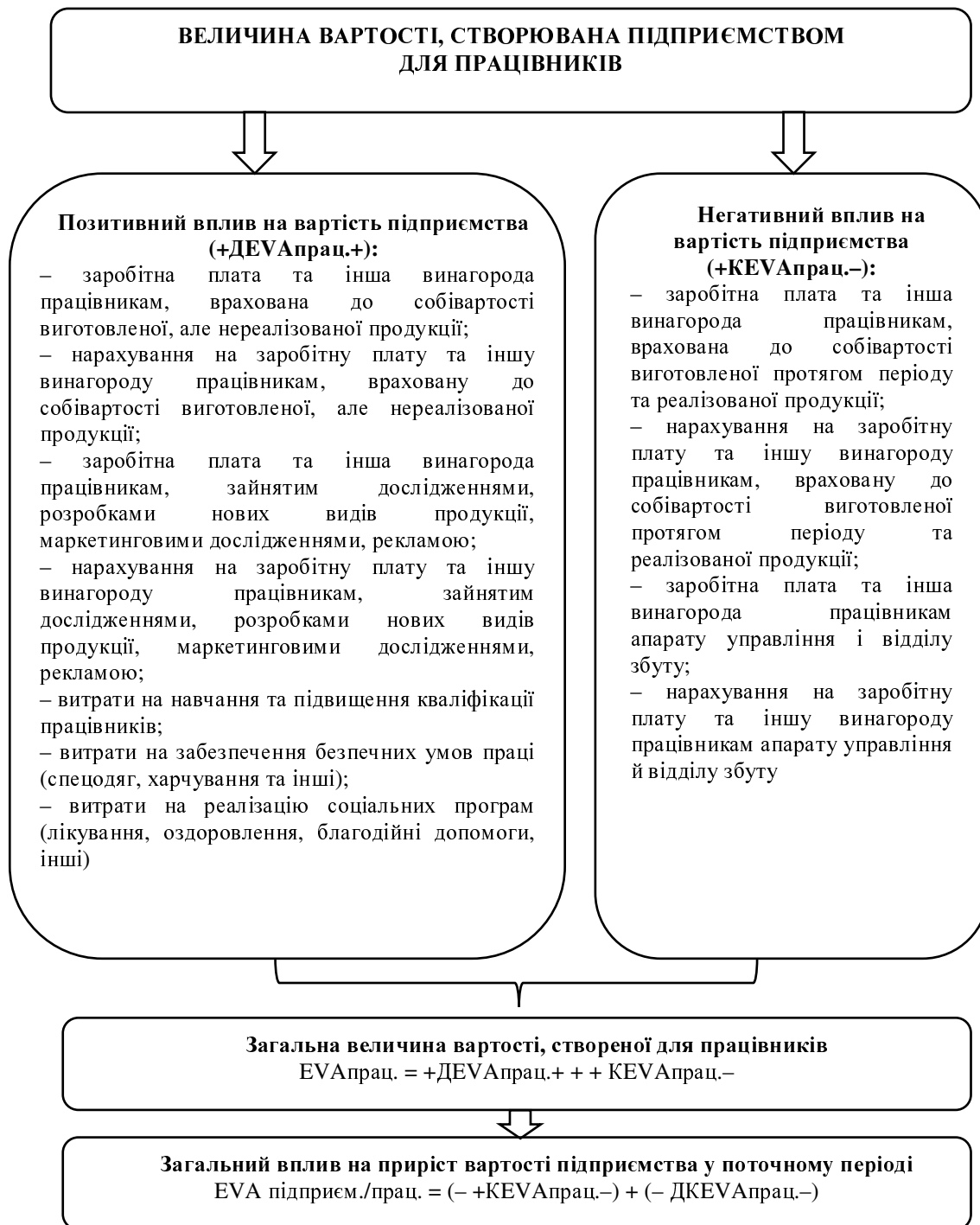
Рис. 2. Величина вартості, створювана підприємством для працівників [13, с. 99–100]

Відповідно величина вартості, створеної підприємством для працівників протягом періоду, дорівнюватиме сумі +DEVA_{\text{прац.}} та +KEVA_{\text{прац.-}} , а при визначенні впливу приросту вартості для працівників на загальний приріст вартості підприємства у поточному періоді враховуватиметься лише остання частина, причому зі знаком мінус. Це зумовлено фактичним включенням витрат, зарахованих до витрат періоду та до собівартості реалізованої продукції, що негативно впливають на фінансовий результат. Перша ж частина приросту вартості, створеної підприємством для даної групи стейкхолдерів, списуватиметься протягом наступних періодів, під час яких підприємство отримуватиме вигоди від понесених витрат. Крім цього, у зменшенні величини приросту вартості враховуватиметься частина вартості, створена для працівників у попередніх періодах ( DKEVA_{\text{прац.-}} )[13].