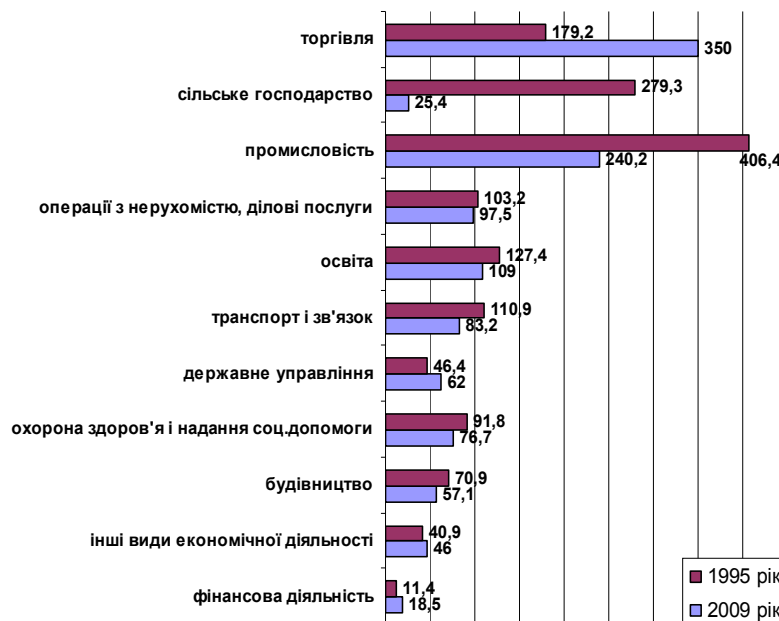
Рис. 2. Кількість зайнятого населення за видами економічної діяльності у 1995 та 2009 рр. в Харківській області, у тис. осіб.